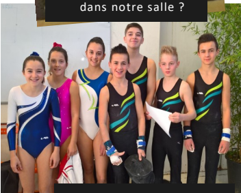
Une partie des 18 gyms du GAC en compétition