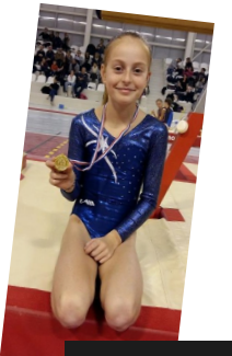
Swan, qualifiée pour les régionaux