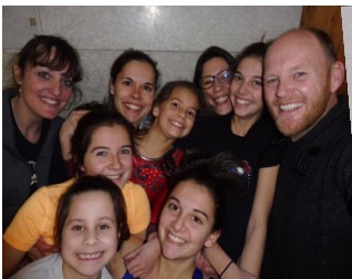
La fine équipe ! La bonne humeur est au RV...